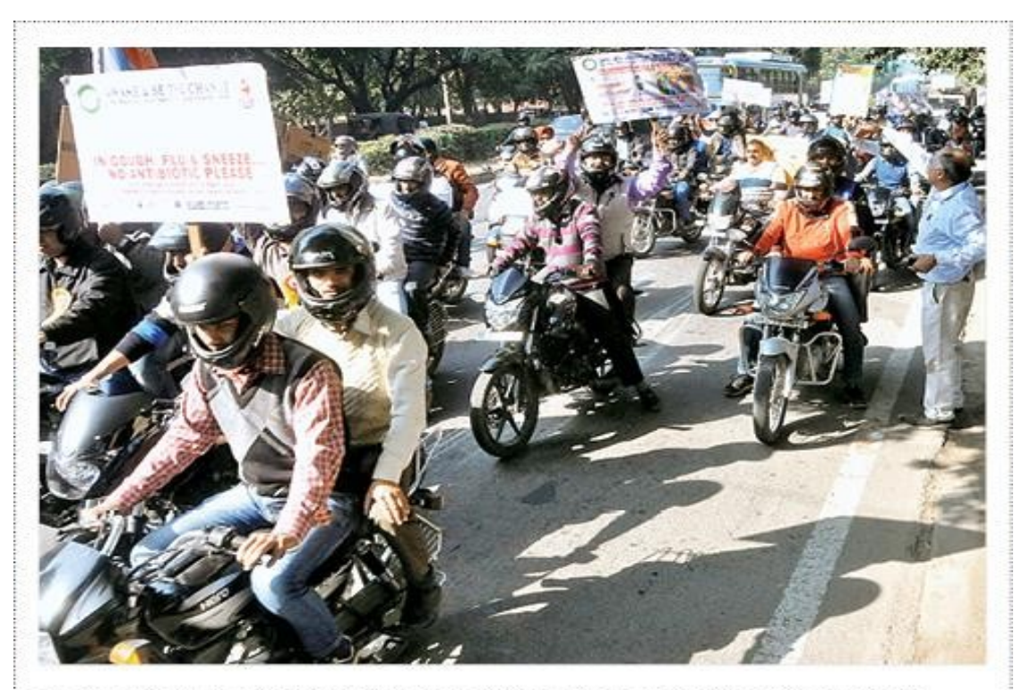
The Emerging Anti-microbial Resistance Society orgnised a motorbike rally to convey the message on the judicious use of antibiotics across the Tricity at Sector 32 in Chandigarh on Saturday. SANJAY GHILDIYAL