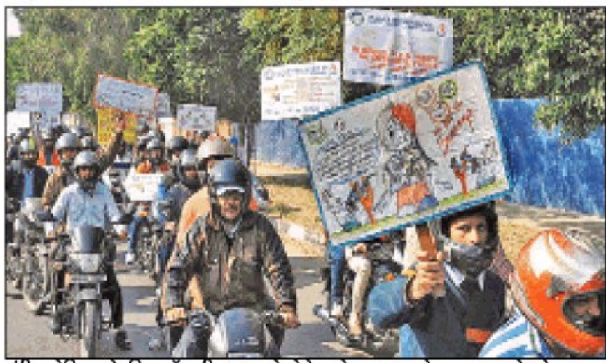
एंटीबायोटिक्स के बिना डॉक्टरी सलाह से होने वाले नुकसान से आगाह करते लोग।

इन दवाओं के बिना किसी सोच समझ के इस्तेमाल से जानलेवा बैक्टीरियल समूहों को फिर से मजबूत होकर वापसी करने का मौका मिला है और वे अब सबसे सशक्त एंटीबॉयोटिक्स से भी बेअसर रहते हैं। एक दवा प्रतिरोधी बैक्टीरिया समूह कई बार जान तक जोखिम में डाल सकते हैं। समस्या के बारे में लोगों का ध्यान आकर्षित करने के लिए एर्मिजिंग एंटीमाइक्रोबॉयल रिजिसटेंस सोसायटी (ईएआरएस) ने 15 से 22 नवंबर तक एक सप्ताह तक चलने वाला जागरूकता अभियान आयोजित किया। एंटीबॉयोटिक्स के तार्किक इस्तेमाल को प्रोत्साहित करने के लिए इस अभियान में डॉक्टर्स, क्लीशियंस, फार्मासिस्टस और आम लोगों को जोडा गया।