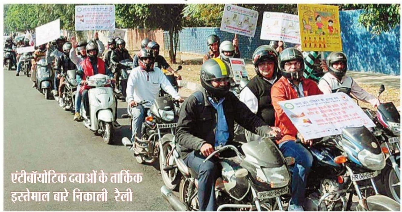
मोहाली, 22 नवम्बर (नियामियां) : एंटीबॉयोटिक दवाओं के तार्किक इस्तेमाल को प्रोत्साहित करने के लिए और डाक्टर की तरफ से बहुत जरूरी होने पर ही यह दवा लिखने संबंधित जागरूकता फैलाने के लिए मोहाली में एक बाइक रैली का आयोजन किया गया। रैली में सवार बाइक सवारों ने अपने हाथों में एंटीबॉयोटिक दवाओं के कारण होने बाल नुक्सान और उनकी जरूरत अनुसार ही प्रयोग करने सम्बन्धित तिष्वयां पकड़ी हुई थीं। यह बाइक रैली सैक्टर 67 में स्थित नैशनल इंस्टीच्यूट ऑफ फॉर्मास्युटिकल रिसीच (नाइपर) से आरंभ होकर शहर के अलग-अलग अस्पतालों (फोर्टिस, कासमो, आई.वी.वाई., मैक्स आदि से होती हुई चण्डीगढ़ के सैक्टर-32 के अस्पताल से पंचकुला के सैक्टर 6 स्थित हस्पताल में जाकर समाप्त हुई। मोहाली में एंटीबॉयोटिक दवाओं के तार्किक इस्तेमाल बारे निकाली गई बाइक रैली का दुश्य।