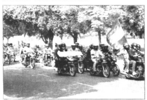
★ रैली निकालते हुए ई.ए.आर.एस. वालंटियर्स।

चंडीगढ़ (मनोज) : 60 बाइकस का एक कारवां ई.ए.आर.एस. वालटियर्स के साथ 22 किलोमीटर का सफर तय कर ट्राईसिटी के बड़े अस्पतालों में गया। ई.ए.आर.एस. ने 15 से 22 नवंबर तक विभिन्न गतिविधियां आयोजित की ताकि डाक्टर्स, क्लीनिशयर्स, फार्मासिस्टस और आम लोगों के बीच एंटीबॉयोटिक्स के तार्कित इस्तेमाल को लेकर जागरूकता बढाई जा सके । ई.ए. आर. एस. इनीशिएटिव के तहत रिसर्च लैब्स, वलीनिक्स, इस्टीच्यूट्स, फार्मासियुटिकल पब्लिकेशंस से 18 एंडोर्समैंट मिले, आम लोगों का समर्थन भी मिला। इसके साथ ही ई.ए.आर.एस. की सदस्यता पिछले साल की 11 हजार से बढ़कर 20 हजार से अधिक हो गई है।